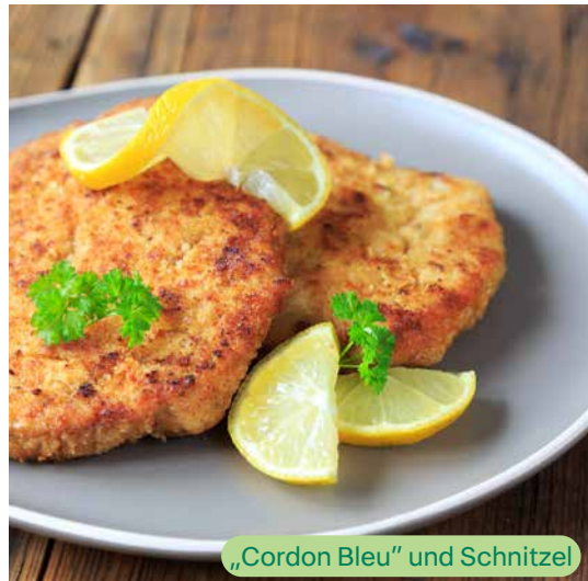
„Cordon Bleu“ und Schnitzel