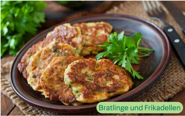
Bratlinge und Frikadellen